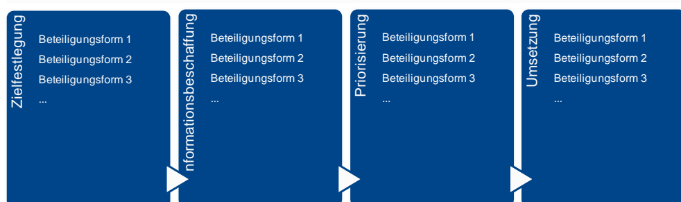
Abb. 2: Prozess der beteiligungsorientierten Erhebung von Lebenslagen zur jugendpolitischen Schwerpunktsetzung

Im Folgenden werden die vier Phasen des Planungsprozesses unter dem Gesichtspunkt der Möglichkeiten der Beteiligung einzeln dargestellt. Selbstverständlich sollten die Phasen des Prozesses in der Umsetzung aufeinander aufbauen. Zur Verdeutlichung und Konkretisierung der Argumentation greifen wir in jeder Planungsphase auf das gleiche Beispiel zurück. Das Beispiel beschreibt eine Situation in einer Kommune, die sich vorgenommen hat, die Beratungsmöglichkeiten für Jugendliche zu verbessern. In einem gesonderten